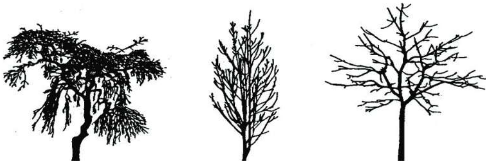
Beispiele verschiedener Kronenformen