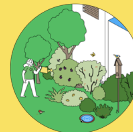
Hecken aus einheimischen Gehölzen