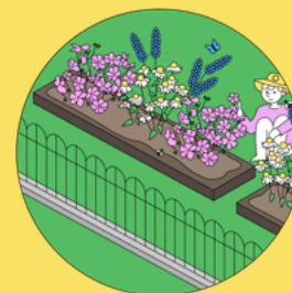
Artenreiche Blühstreifen oder Beete

Im Prozess können sich Gemeinden z.B. für diese Maßnahmen entscheiden: